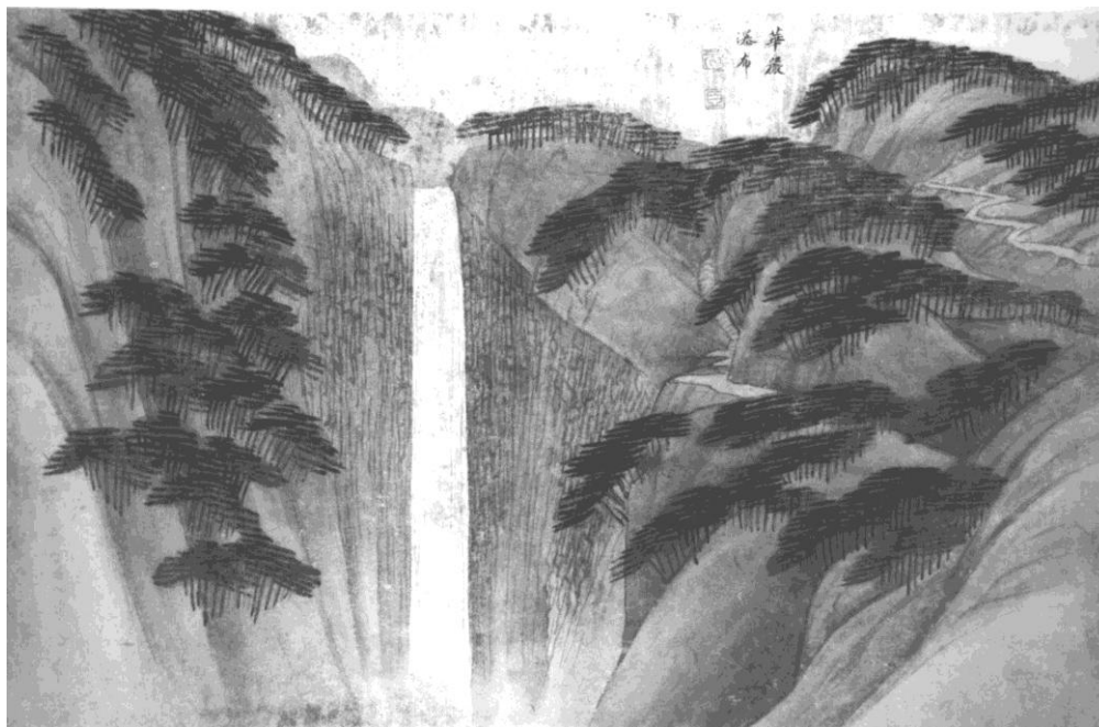
谷元旦筆 下野国内風景画 江戸時代 当館蔵