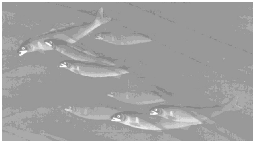
小泉斐筆 鮎図(部分)江戸時代 当館蔵