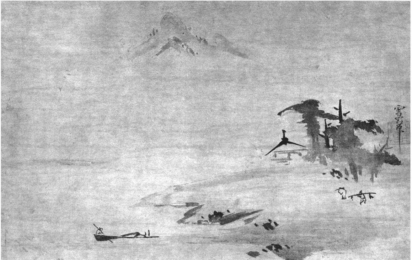
雪閑筆 草体山水図 室町時代 当館蔵